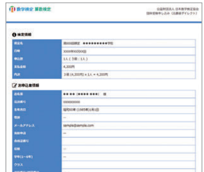
▲ 受検申込ページ確認画面

※「受検申込ページ」は、インターネット申込・決済サービス「イベントベイ」の申込専用ページです。