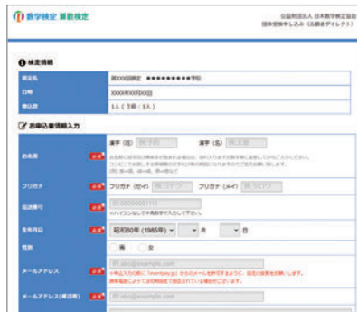
▲ 受検申込ページ入力画面