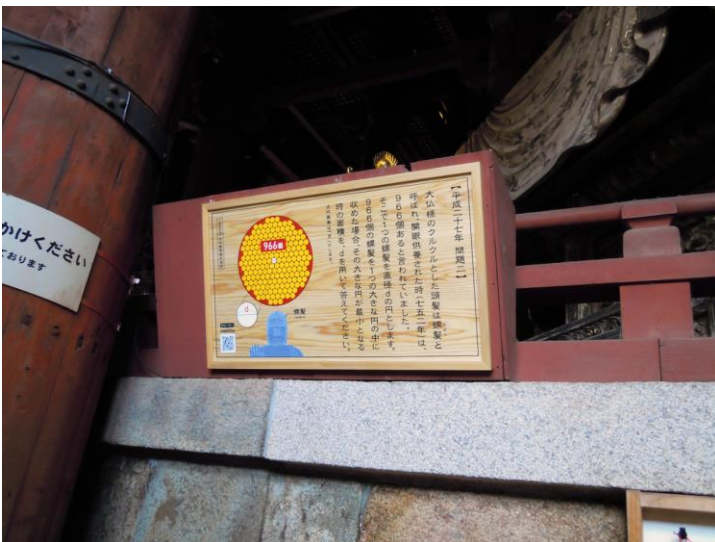
奉納した算額 その2