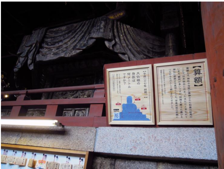
奉納した算額 その1