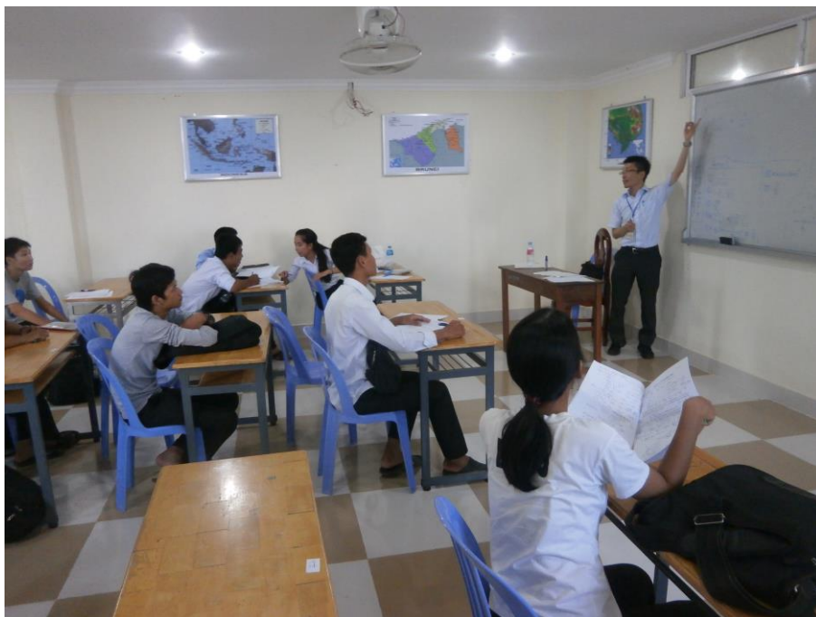
算数・数学の学習支援をかねた講習会の様子