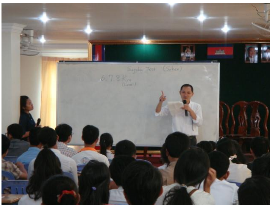
検定前日の事前説明の様子