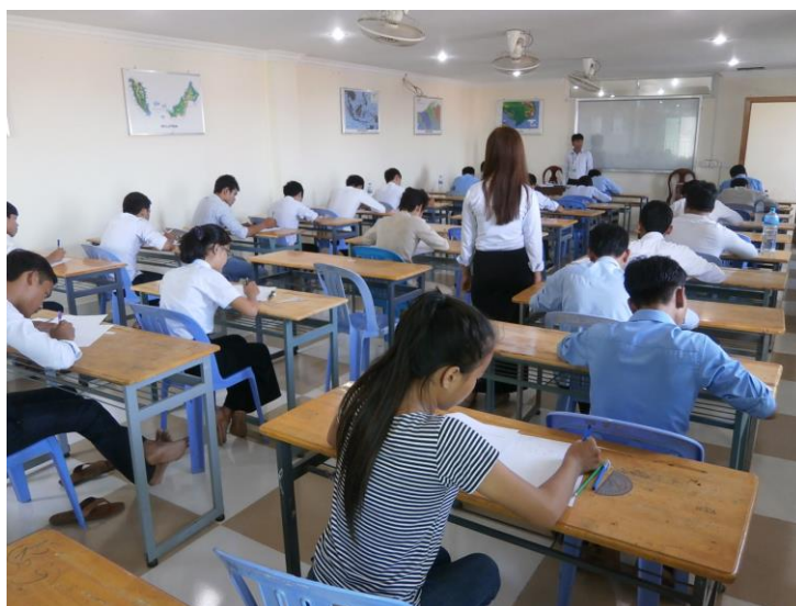
カンボジアで検定を実施している様子

公益財団法人日本数学検定協会（所在地：東京都台東区、理事長：清水 静海）は、2015年9月30日にカンボジアの Khemarak 大学（プノンペン）で、カンボジア数学会の協力のもと実用数学技能検定（数学検定・算数検定）を実施いたしました。カンボジアでの検定の実施は、今回で7回めで、1～8級の10階級に約250人の児童・生徒が志願し、これまでの累計志願者数はのべで2,000人を突破しました。